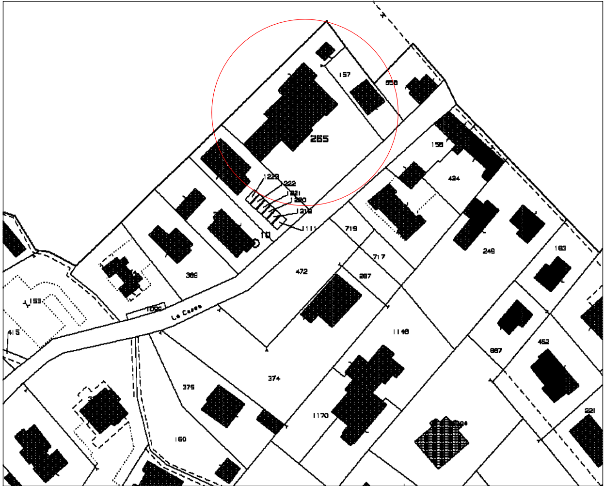
ESTRATTO PIANO D'AREA – SCALA 1:10000